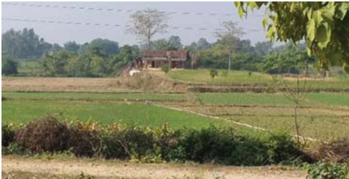
सिधनियाशाखा र सिंचित क्षेत्र ।

यसै गरी २०७६/८/१६ देखि chainage 34+700 बाट निस्कने दोस्रो डुडुवा शाखामा र मुलनहरको अन्तिम बिन्दु chainage 45+250 बाट जेठी नालामा पानी खसालिएको छ। नहरबाट पम्पको माध्यमबाट गहुँ खेतीमा संभाव्य क्षेत्रमा सिंचाइ भईरहेको छ भने नहरको अन्तिम बाट जेठी नालामा खसालिएको पानीबाट बाँके जिल्लाकै तल्लो क्षेत्रका धवलागिरी र किरणनाला लिफ्ट सिंचाइ प्रणालीहरु लाभान्वित हुने देखिएको छ।