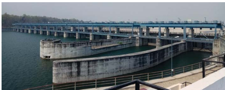
आयोजनाको निर्माण सम्पन्नबाँध।

बाँके जिल्लाको राप्तीपश्चिमको ३३,७६६ हे. कृषि योग्य जमिनमा सिंचाइ सेवा उपलब्ध गराउन आ.व. २०६३/६४ देखि निर्माण शुरु भएको सिक्टा सिंचाइ आयोजनामा आ.व. २०७१/७२ मा राप्तीपूर्वको ९००० हे. समेत समावेश गरी जम्मा ४२,७६६ हेक्टरमा सिंचाइ सुविधा उपलब्ध गराउन रु. २५ अर्ब २ करोडको स्वीकृत गुरु योजना अनुरूप काम भईरहेको छ।