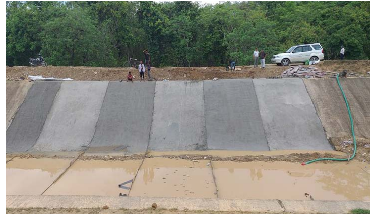
२०७५/४/७ मा भत्किएको स्थानमा भएको मर्मत ।

आयोजनाबाट यस समस्या समाधानकालागि अन्तर्राष्ट्रिय प्रचलन समेतका आधारमा मर्मत सुधार गर्न परामर्श सेवा लिन प्रस्ताव गरिएको भएता पनि २०७६ को वर्षातको अगाडि थप क्षति हुन नदिन मन्त्रालयको छानविन समितिको प्रतिवेदन, घुलनशील माटोमा भएका मर्मतका case study प्रतिवेदनहरू समेतका आधारमा sink hole formation, canal bank surface erosion, gully formation मा नदीको river bed material मा lime (बजारमा उपलब्ध कृषिचुन) समेत मिसाई पुर्ने काम २०७६ आषाढ मै शुरु गरिएको छ । नहरमा विगिएका canal lining panel बनाइएको छ ।