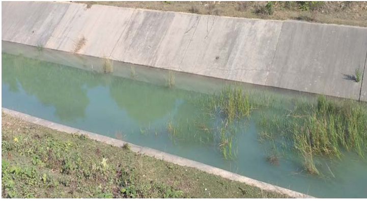
मुलनहरको २८ कि.मी. क्षेत्र ।