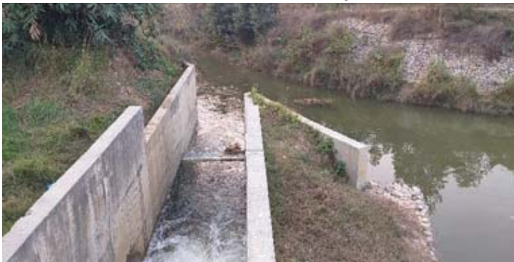
पम्पबाट सिंचाइगर्दै र ४५+२५० कि.मी. जेठी नालामा खसालिएको पानी ।

यसै गरी २०७६/८/१६ देखि chainage 34+700 बाट निस्कने दोस्रो डुडुवा शाखामा र मुलनहरको अन्तिम बिन्दु chainage 45+250 बाट जेठी नालामा पानी खसालिएको छ। नहरबाट पम्पको माध्यमबाट गहुँ खेतीमा संभाव्य क्षेत्रमा सिंचाइ भईरहेको छ भने नहरको अन्तिम बाट जेठी नालामा खसालिएको पानीबाट बाँके जिल्लाकै तल्लो क्षेत्रका धवलागिरी र किरणनाला लिफ्ट सिंचाइ प्रणालीहरु लाभान्वित हुने देखिएको छ।