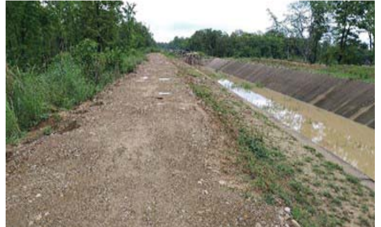
घुलनशील माटोका कारण क्षतीग्रस्त नहरको डिल मर्मत अगाडि र मर्मत पश्चातको स्थिति ।